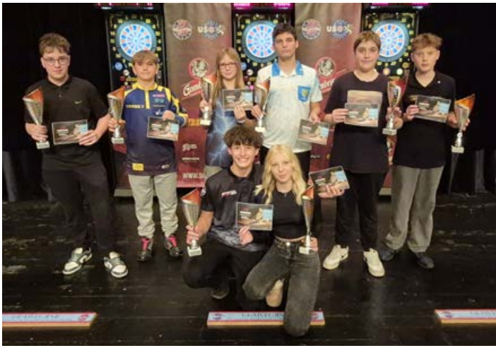
MČR dvojic mládeže společná fotka