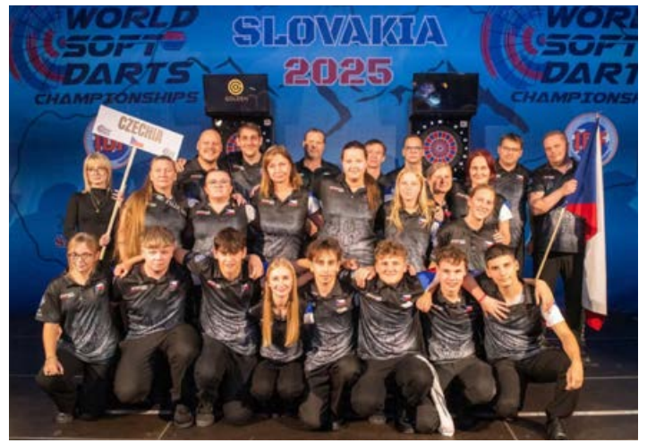
Oficiální reprezentace ČR na IDF na Slovensku Listopad 2025.